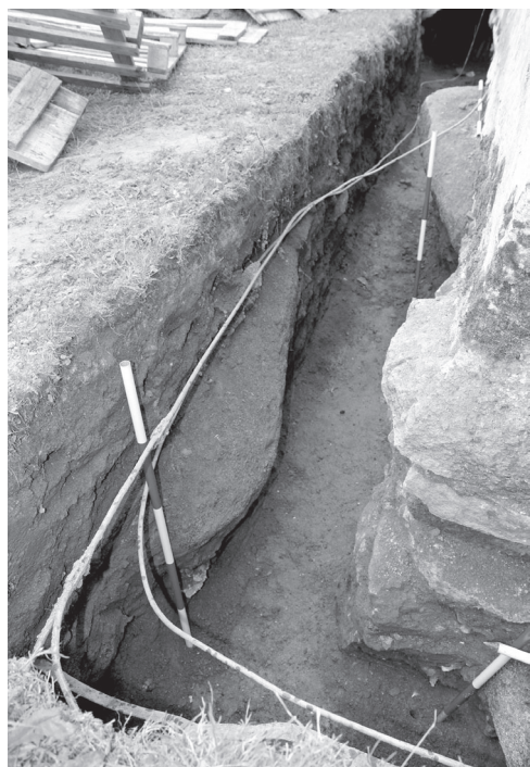
Obr. 2. Počepice, situace s náhrobními kameny, září 2017. Foto R. Korený.

Abb. 2. Počepice, Situation der Grabsteine, September 2017. Foto R. Korený.