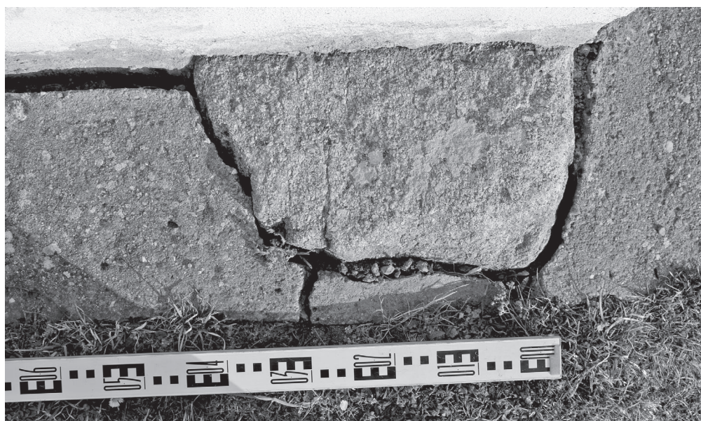
Obr. 5. Počepice, severozápadní nároží lodě kostela Narození sv. Jana Křtitele, část náhrobního kamene 1/2021.