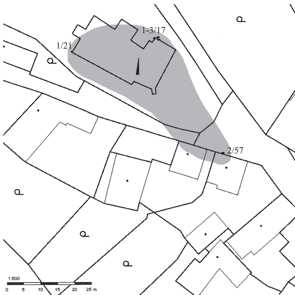
Obr. 6. Počepice, plán s hroby 2/1957, 1–3/2017 a 1/2021; šedou předpokládaná minimální rozloha řadového pohřebiště. Mapový podklad ČUZK, upravil R. Korený.