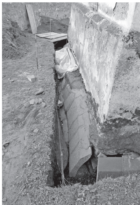
Obr. 3. Počepice, situace s betonovými prvky drenáže, respektujících náhrobní kameny, září 2017. Foto R. Korený.

Abb. 2. Počepice, Situation der Grabsteine, September 2017. Foto R. Korený.