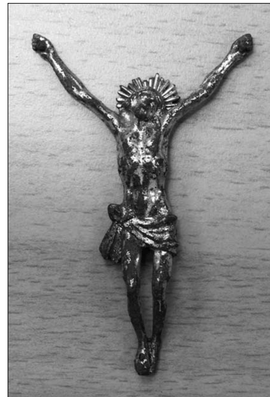
5 Dobříš. Plastika Krista inv. č. 37961.

Třetí z nálezů, inv. č. 37960 (obr. 4), má jako předchozí propracovanou muskulaturu a mírně zakloněnou hlavu, natočenou k pravému rameni. Pohled Krista se opět upírá vzhůru, z rysů obličeje lze v tomto případě rozpoznat i vousy. Dlouhé vlasy na hlavě doplňuje trnová koruna. Paže jsou napnuté, v úhlu cca 60° k ose těla, dlaně pravé i levé ruky obsahují zbytky hřebů. Nohy se na rozdíl od ostatních plastik vzájemně nedotýkají, jsou zřetelně pokrčené, v chodidlech pravé i levé zůstal patrný otvor po hřebu. Přílehavou bederní roušku zakončuje úzký cíp visící po Kristově pravém boku. Celá plastika je pečlivě propracovaná, s jemnými detaily, které bohužel byly výrazně