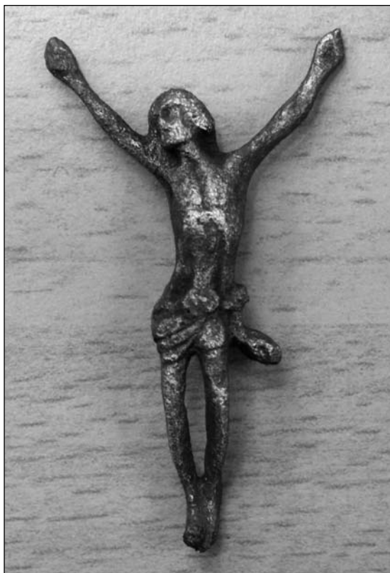
2 Dobříš. Plastika Krista inv. č. 37958.