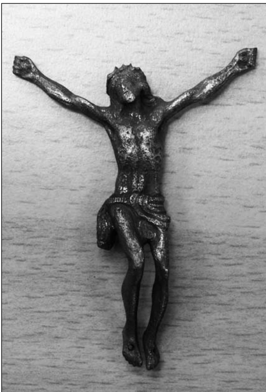
4 Dobříš. Plastika Krista inv. č. 37960.