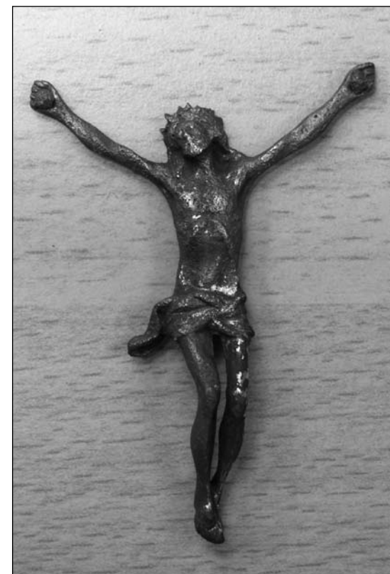
3 Dobříš. Plastika Krista inv. č. 37959.

Nález inv. č. 37958 (obr. 2) představuje mosazný odlitek ve formě plasticky provedené postavy ukřižovaného Krista s hlavou mírně natočenou k pravému rameni. Hlavu zdobí dlouhé vlasy, ze zachovaných rysů obličeje je patrné, že pohled Krista směřuje vzhůru. Paže jsou napnuté v úhlu cca 70° k ose těla. V dlani pravé i levé ruky se zachovaly zbytky po železných hřebech. Nohy se lehce prohýbají do „tvaru O“, dotýkají se v chodidlech, v jejichž středu se nachází zbytky železného hřebu. Bedra postavy ovíjí rouška orientovaná doleva, tj. uzel roušky je umístěný na Kristově levém boku a doleva směřuje