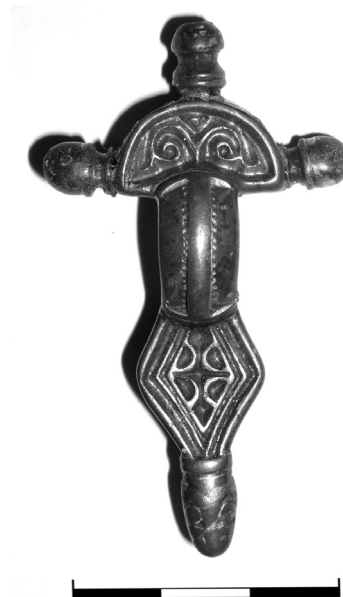
Obr. 2. Stehelčevs, okr. Kladno. Hrob 2, spona

Spony s ptačími hlavičkami (Koch 1998, typ VII.2.2-Gruppe B). Stejnou výzdobu nožky vykazuje pár stříbrných pozlacených spon z hrobu 192 z Villingendorf, Ldkr. Rottweil. Od spínadel t. Oberwerschen se liší právě jen záhlavní částí spony (obr. 3:7; Frank 2008, Abb. s. 41). K uvedenému páru lze počítat i sponu z hrobu 46 z Villey-Saint-Étienne, Dép. Meurthe-et-Moselle (obr. 3:6; Koch 1998, 396–399, 653, Taf. 50:15). Její nožka je zdobena týmž motivem, byť v poněkud geometrizujícím stylu. 8