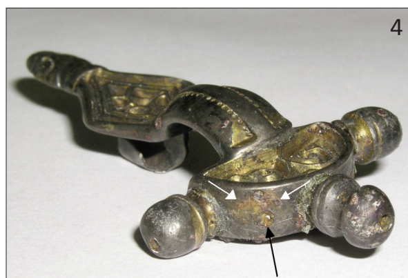
Fototab. 1. Stehelčevy, okr. Kladno. Spona z hrobu 2. 1, 2 – celkový pohled; 3 – detailní pohled na levou polovinu hlavice, černá šipka ukazuje na otvor pro železný trn druhého knoflíku a bílé šipky směřují na okraje korozní stopy kruhového tvaru po knoflíku; 4 – detailní pohled na pravou polovinu hlavice, černá šipka ukazuje na otvor pro železný trn čtvrtého knoflíku a bílé šipky směřují na okraje korozní stopy po knoflíku. (k článku R. Koreného Spona typu Oberwerschen ze Stehelčevsi, okr. Kladno , str. 331–336)